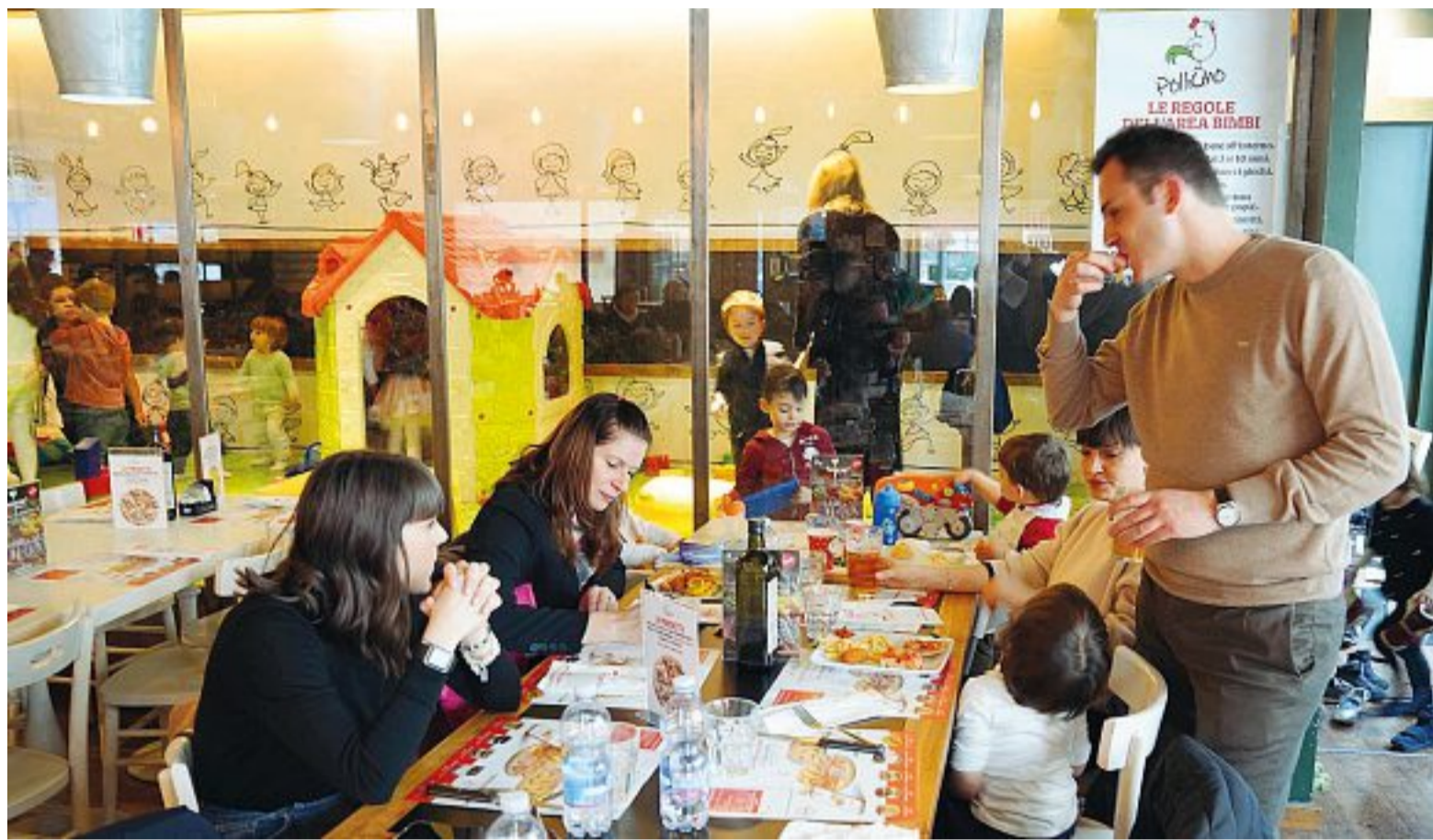
Insieme appassionatamente Genitori e figli pranzano insieme al ristorante Pollicino; dietro i vetri, l'area bambini con giochi e wi-fi