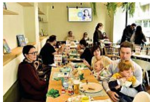
Cibo e creatività In alto: bambini creano la loro pizza al Pollicino. Qui sopra: una famiglia a un tavolo di Benvenuto

dei titolari: «Sono locali nati apposta per accogliere i più piccoli e dove i genitori possono trascorrere qualche ora senza pensieri». Ecco allora che oltre all'area giochi per i più piccoli, insonorizzata, c'è anche la zona play station per i ragazzi dai 9 anni in su. Vengono grandi compagnie di amici con i figli «ma anche papà divorziati, soprattutto a pranzo, e giovani coppie». Domenica brunch all you can eat (€ 20 adulto, 10 bambini) con «baby cooking»: i bambini preparano la pizza e poi la mangiano o la portano a casa.